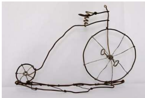
Le grand Bi